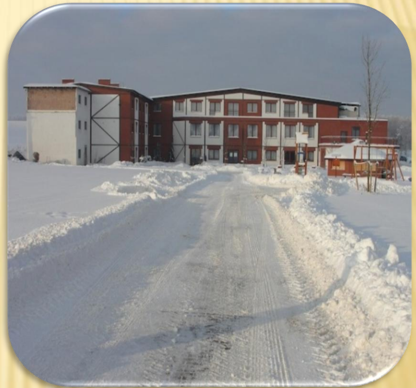
Ośrodek CAMPOVERDE w zimowej scenerii.

□ Warsztaty trwały 5 dni – od 15.04 do 19.04. 2013 roku – stanowczo za krótko!